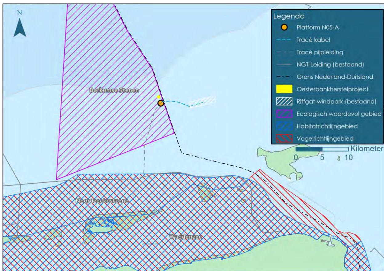
Figuur 2-1 Beoogde locatie van het platform en ligging van de Nederlandse Natura 2000-gebieden en overige waardevolle gebieden.

Het plangebied bevindt zich niet in een Natura 2000-gebied. De meest nabijgelegen relevante Natura 2000-gebieden in Nederlandse wateren zijn de Noordzeekustzone en de Waddenzee. Het plangebied bevindt zich echter wel in het ecologisch waardevol gebied Borkumse Stenen. Dit gebied heeft op dit moment geen wettelijk beschermde status, maar mogelijk wordt de Borkumse Stenen als zelfstandig Natura 2000-gebied aangewezen als Vogelrichtlijngebied.