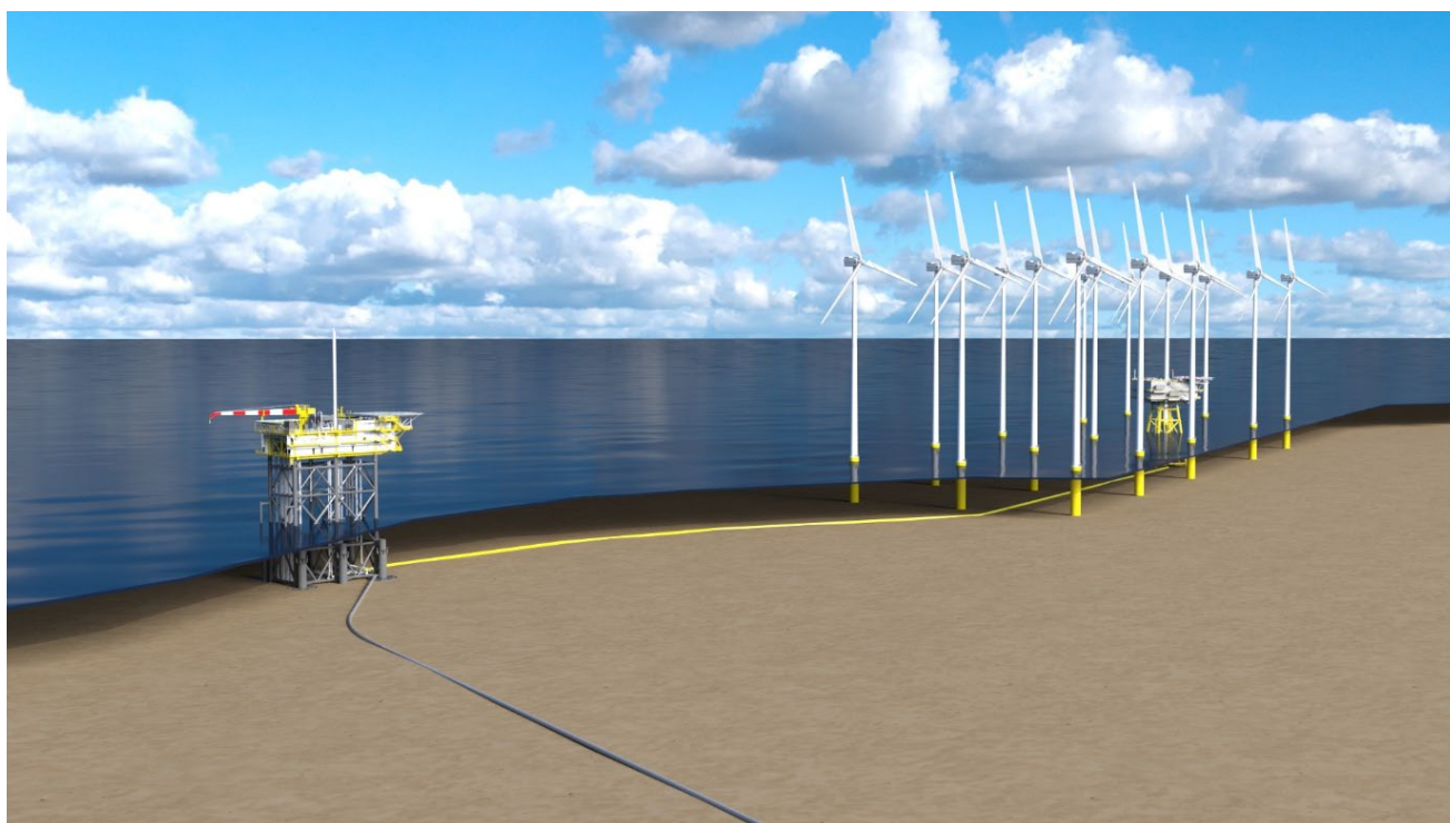
Visualisatie platform N05-A en aansluiting op windpark Riffgat